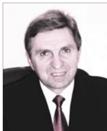
Заместитель главы администрации ОВЕРЧУК СЕРГЕЙ ИВАНОВИЧ

Прием осуществляется 1 раз в месяц, каждый 1-й понедельник с 16.00 до 18.00. Запись на прием – в 113 каб. с 9.00 до 18.00.